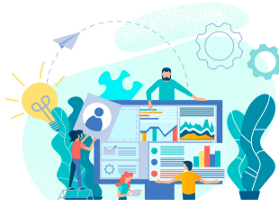
Adista hébergé en LBO bis