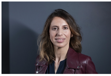
Une présidente à la tête de France Invest